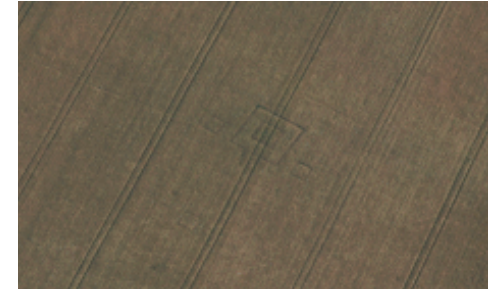
Fanum de Guainville en vallée de l'Eure ( Archéo27)