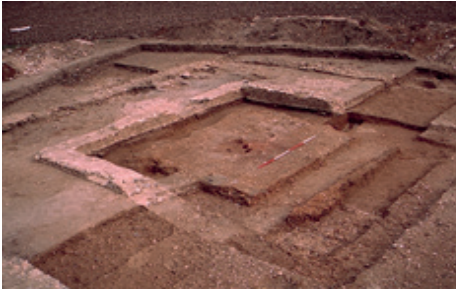
Sanctuaire rural de Bennecourt (SADY)