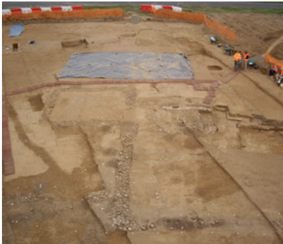
Fouille de la villa du Poirier à Nogent-le-Roi (INRAP)